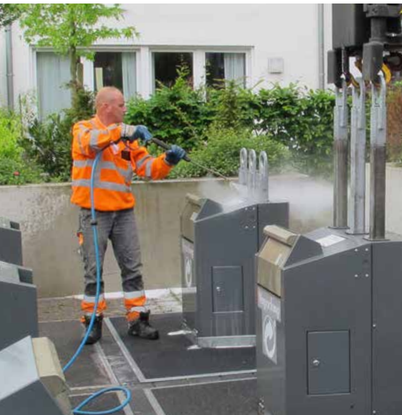
Saubere Sache Standort Service Plus.